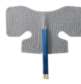
ショルダーラップ 品番:259320