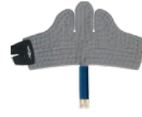
アングラップ 品番:259330